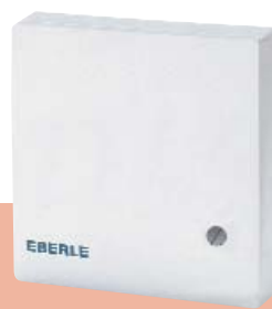
F 190 021