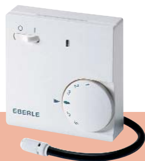
FR-E 525 31