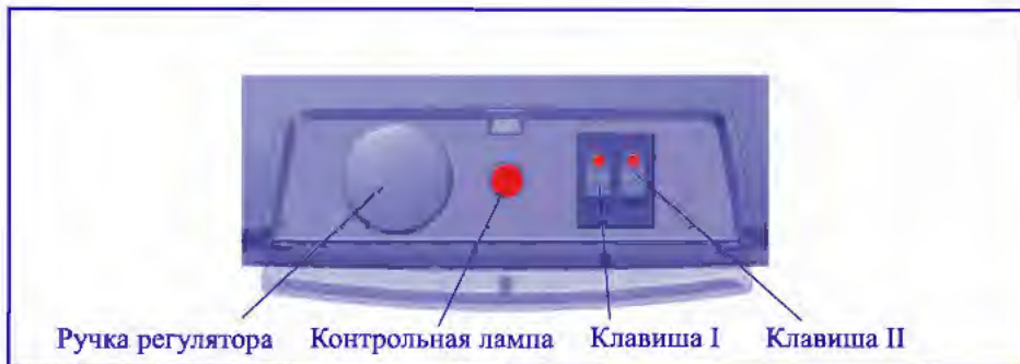
Рис. 1. Панель управления ЭВП.