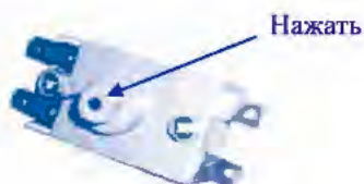
Рис. 3. Расположение кнопки на термовыключателе термостата

⚠ Вышеперечисленные неисправности не являются дефектами ЭВН и устраняются потребителем самостоятельно или силами специализированной организации за его счет.