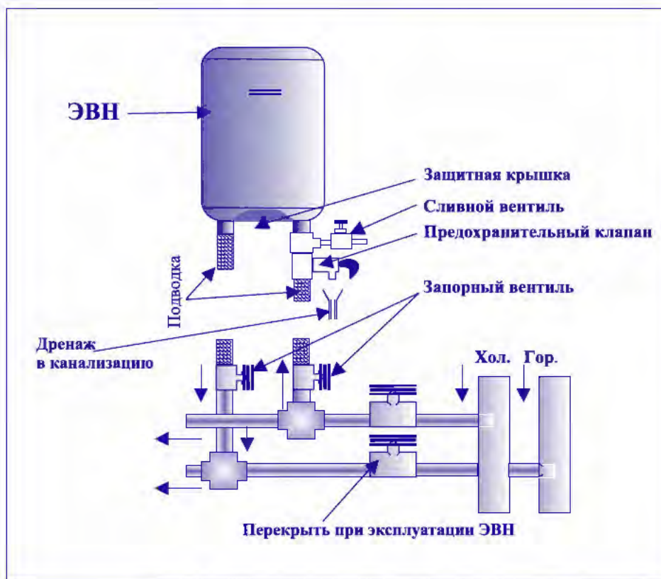
Рис. 2. Схема подключения ЭВН к водопроводу