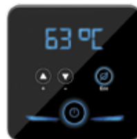
Стильная панель управления

Система самодиагностики: выводит на дисплей сообщения об ошибках, а их расшифровка есть в руководстве по эксплуатации.