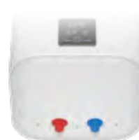
Вывод водяных патрубков снизу