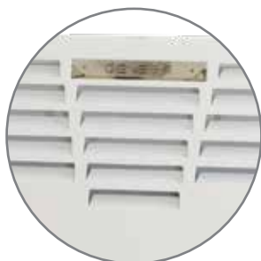
Особая конструкция жалюзи