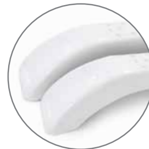
Ножки для напольной установки прибора

Особая конструкция корпуса и жалюзи для эффективного смешивания и мощного выхода горячего воздуха