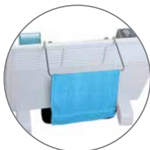
конвектор с увлажнителем и полотенцесушителем