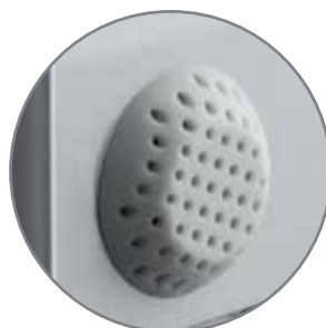
ионизатор на боковой панели прибора